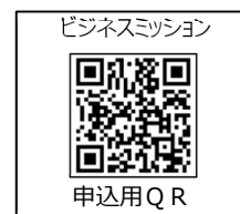
ビジネスミッション 申込用QR