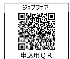
ジョブフェア 申込用QR