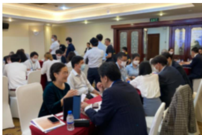
令和4年度 ビジネスマッチングの様子