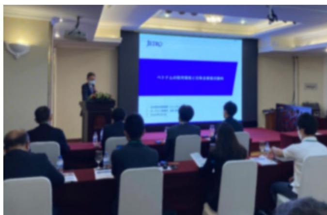
令和4年度 ブリーフィングの様子